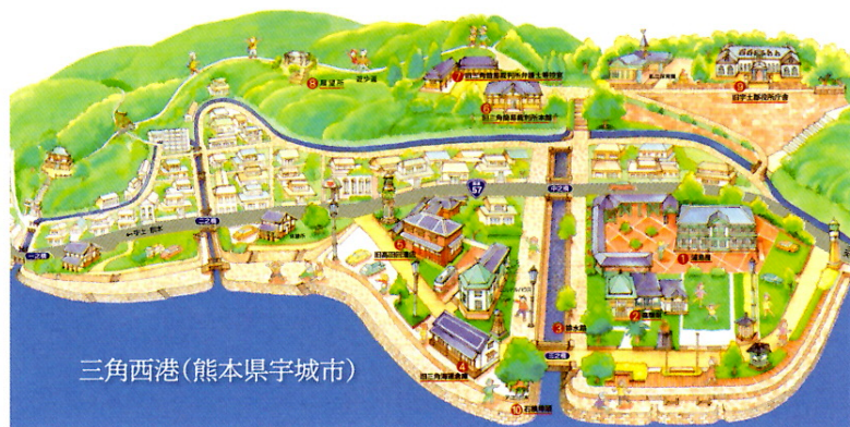
三角西港(熊本県宇城市)

お問合せ:山鹿灯籠民芸館 〒861-0501 熊本県山鹿市山鹿1606-2 TEL:0968-43-1152